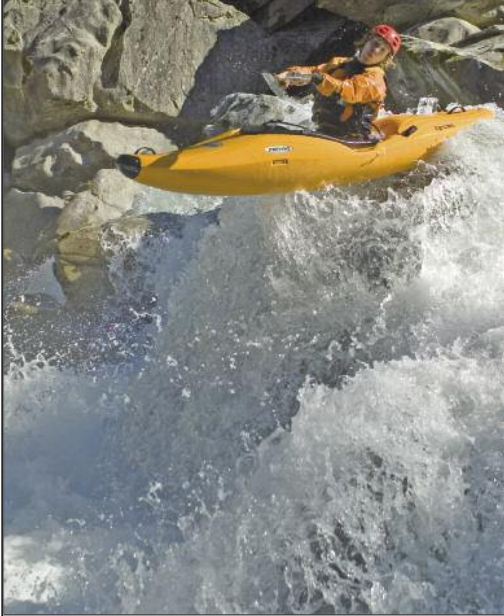
Ötz, Wellerbrückenstrecke, Paddler Thilo Schmitt

Die mit Schaum gedämpfte Prallplatte mit Shock-Absorber ist auf die Beinlänge stufenlos einstellbar und garantiert optimale Sicherheit. Die vordere Schaumplatte dient zum Schutz des Auftriebskörpers.