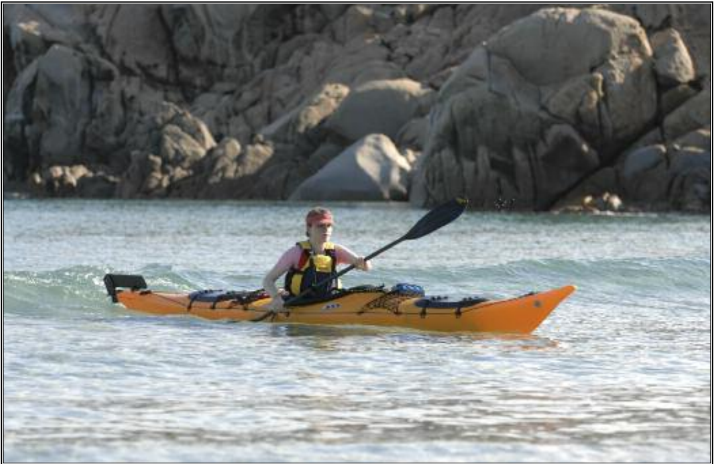
Sardinien