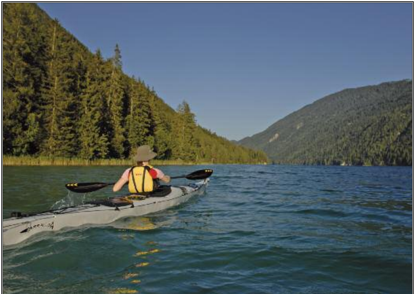
Weissensee, Österreich