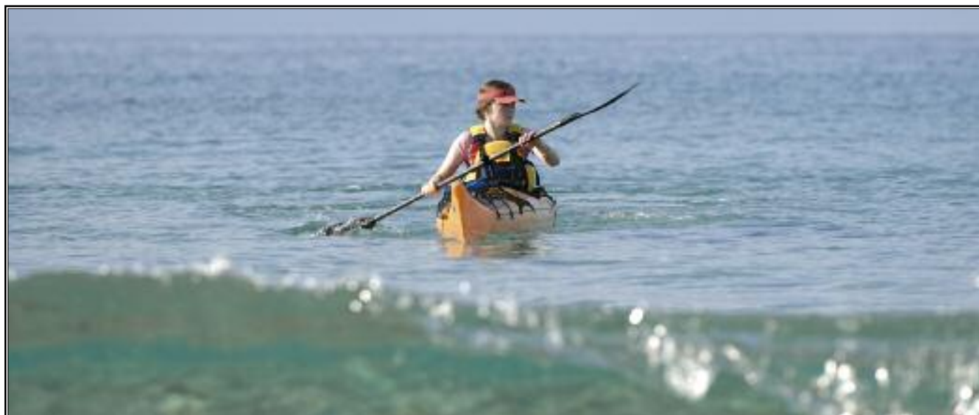
Sardinien