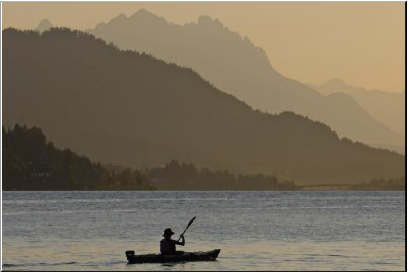
Weissensee, Österreich