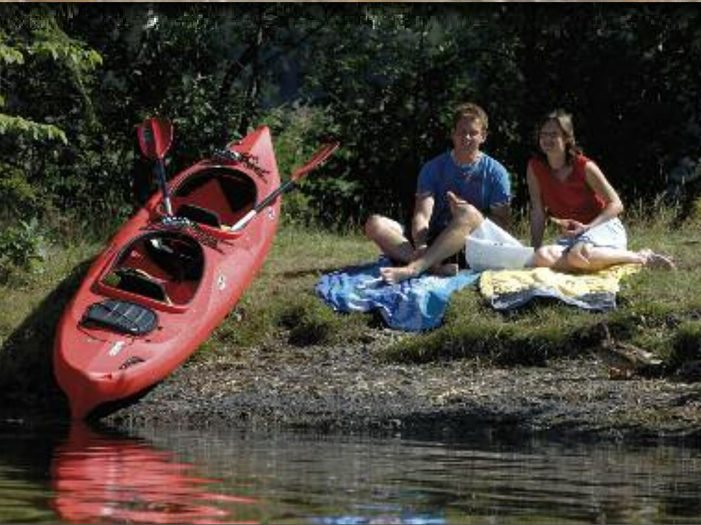
Staffelsee

Viele Familien haben das Paddeln für sich als Freizeitsport entdeckt. Ab Seite 10 in diesem Katalog zeigen wir unser Wander- und Tourenprogramm. Beginnend mit den Kinder – und Jugendkajaks, weiter zu den Einsteiger- und Freizeitbooten bis hin zu voll ausgestatteten Tourenbooten für Flüsse, Seen und das Meer. Für jeden ist das passende Boot dabei.