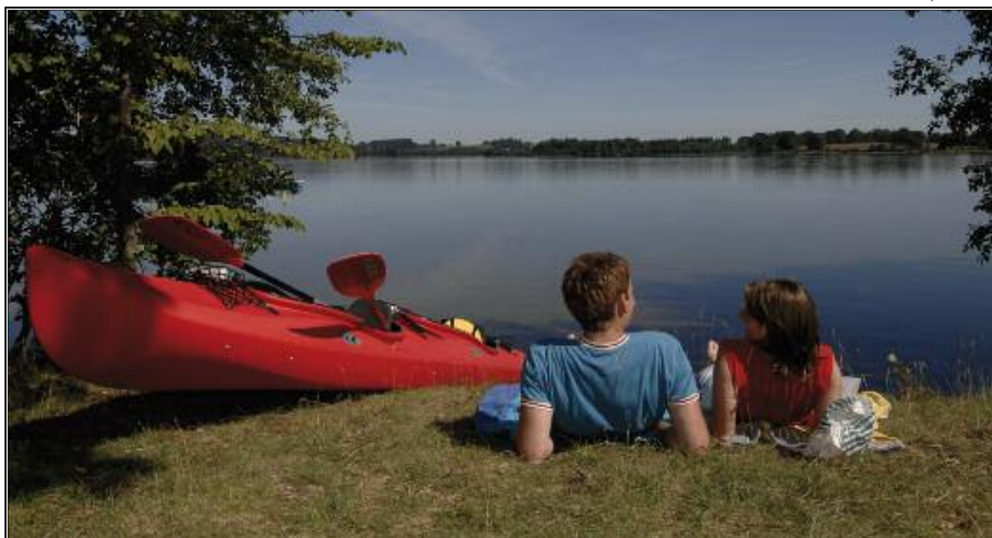
Staffelsee